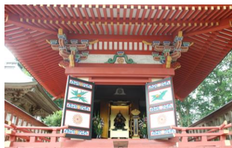
▲伊達成実霊屋御開帳