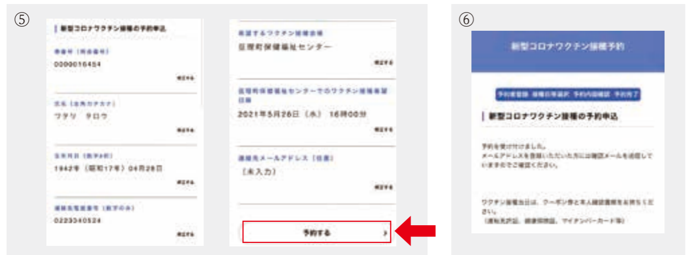
予約内容を確認して「予約する」をタッチしたら予約完了です。