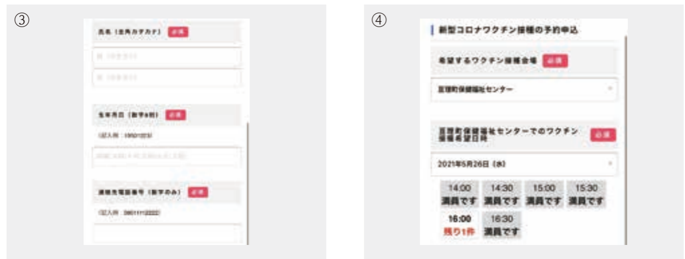
氏名、生年月日、電話番号などを入力します。