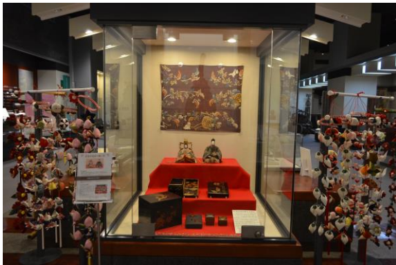
▲巨理伊達家雛人形とつるし雛