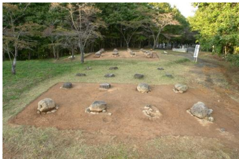
▲正倉院礎石建物跡(南から)