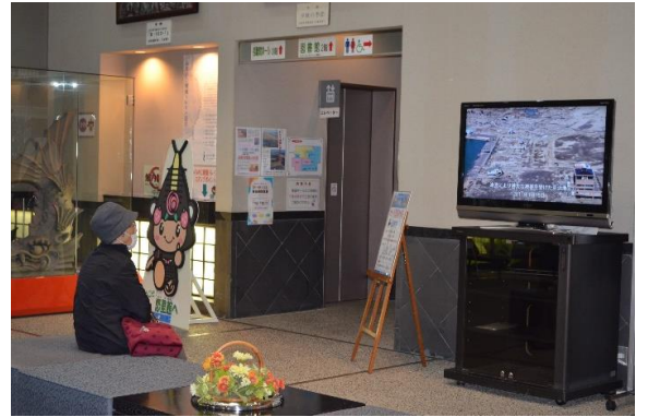
▲わたり復興の歩み上映会の様子

郷土資料館は「震災伝承施設」として、震災の記憶を風化させず後世に伝え続けていくため、今後も毎月11日(休館日を除く)に上映会を行いますので、震災写真とあわせてぜひご覧ください。