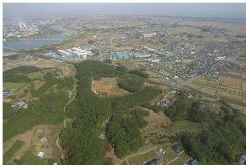
▲三十三間堂官衙遺跡(上空南から)

※「わたりの民話」(1983巨理町教育委員会発行)は郷土資料館で販売しています(価格1,000円)。