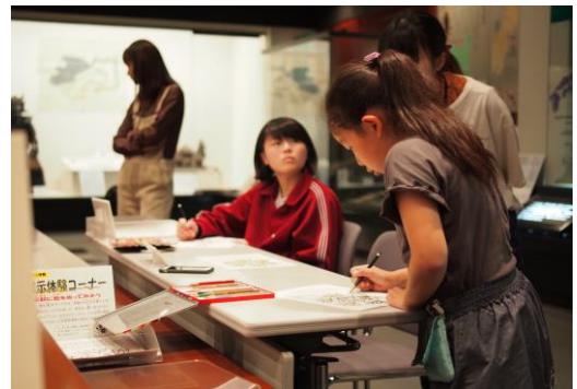
▲家紋ぬり絵に挑戦中!

※感染症対策を行って(じっし)実施しますが、状況により内容変更を行う場合があります。