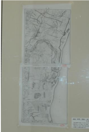
▲巨理町・岩沼市の地図の写し

4月24日(土)から6月20日(日)まで、企画展示室で「収蔵資料展」を開催し、655人の方にご覧いただきました。年度ごとに郷土資料館に寄贈された資料を公開しており、今年で24回目となりました。今回は平成30年度に寄贈された昭和後期から平成初期の家庭用ゲーム機を中心としたおもちゃのほか、当時のくらしぶりなどを伝える資料58点を展示しました。