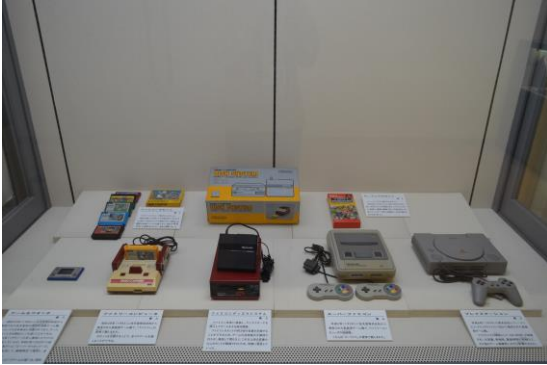
▲レトロゲーム機展示の様子