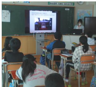
▲左：巨理神社の碑を見学する高屋小学校6年生 右：教室での学習の様子