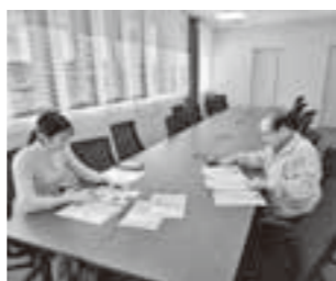
正確な情報をお届けします

②記事の校閲 編集を行う前に、提出された原稿の記載内容に間違いがないか、広報委員が資料等を用いて確認します。 ③紙面の編集 編集のため広報委員会を開催。見やすい紙面となるよう広報委員6名が意見を交わします。