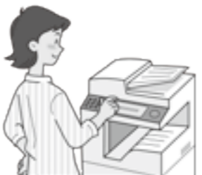
コンビニ交付サービス

【問】今後の行政改革は。 【答】民間的経営を取り入れながら「最小の経費で最大の効果」を基本とし、事業見直しや業務改善に取り組めます。 ※全国自治体行政サービス改革度「地方行政サービス改革の取組状況等」に関する調査等「結果を、時事総合研究所が点数化しランキングしたものの。