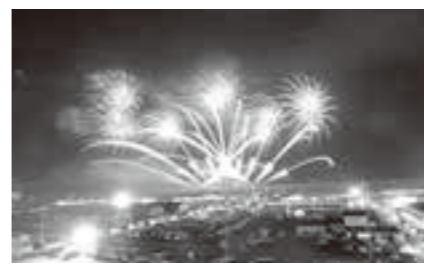
イベント時の防災対策の徹底を

隊員のスキルを生かした活動が行えるようサポートをしています。 【問】ワタリタウンベイエリアコンセプトの今後は。 【答】国・県の補助事業を活用しながら整備します。 ■中学校部活動の地域移行 【問】担当課を生涯学習課に移した理由は。 【答】地域団体との調整を図るためです。 【問】保護者への説明会は。これからの説明会を開催していく予定です。