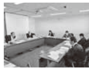
記事内容、レイアウトをより良いものに

①取材・原稿の作成 議会資料や会議録を参照しながら各原稿を作成します。 また、広報委員は巻頭・巻末記事を作成するため町内の学校等に取材に伺います。