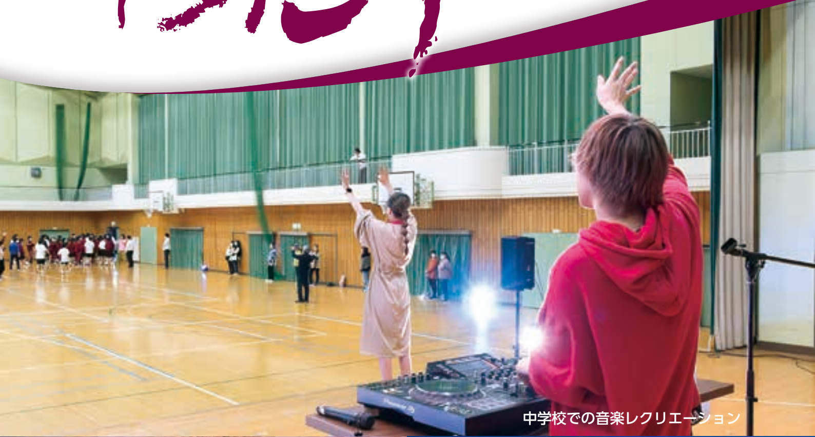
中学校での音楽レクリエーション