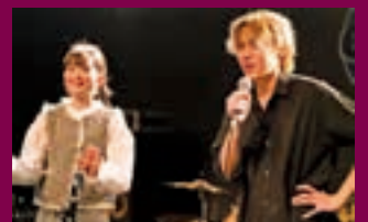
巨理高校でのライブ