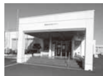
逢隈地区交流センター

■Wi-Fi整備は 【問】避難所などに整備しては。 【答】全小中学校に昨年10月で公衆無線LAN（フリーWi-Fi）を使用できるよう整備しました。 【問】各交流センターの会議室でも住民サービスの観点から使えるようにすべきでは。 【答】住民サービスの観点からするとその通りですが、ウイルス感染などの問題もあり総合的に検討します。