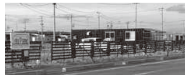
協力隊員が活動するエリア

【問】 今後、隊員に期待することは。任期終了後も定住し、引き続き地域活性化に資する活動を行っていただきたいと考えています。町内で起業する場合は継続的に支援します。