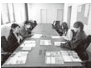
取材にご協力ありがとうございます

①取材・原稿の作成 議会資料や会議録を参照しながら各原稿を作成します。 また、広報委員は巻頭・巻末記事を作成するため町内の学校等に取材に伺います。