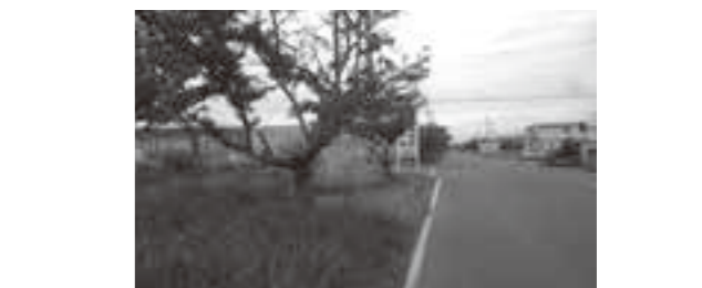
江下1号線と江下荒浜線の交差点