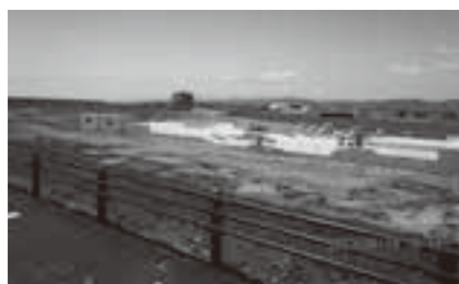
今後の観光振興対策が急がれます

鳥の海エリア観光構想について 鳥の海観光構想は継続しているのか。 荒浜地区を中心とした観光エリアの創出は町全体の活性化に寄与するものであり、各事業については、再度整理します。 民間提案制度の見通しは。 制度を有効に活用し、町全体の発展に努めてまいります。