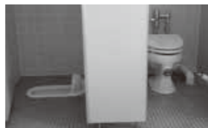
各学校のトイレ洋式化へ

トイレを増やしていただけないかという声があるが、本町の取組は。 洋式化率が低い小中学校については、国庫補助の採択を目指し、トイレの洋式化推進に努めてまいります。 吉田小学校と高屋小学校の低学年用女子トイレ、和式は要らない。全て洋式にしては。 改修等を行う場合は、考慮しながら検討し