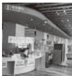
ワンストップ手続きを