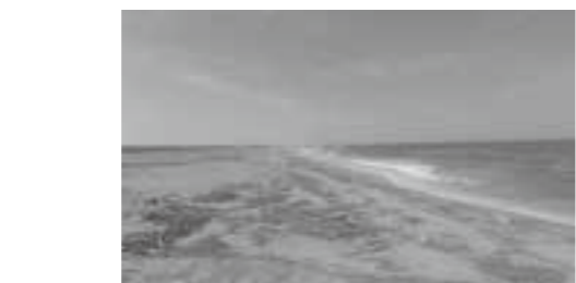
流木が漂着した吉田浜