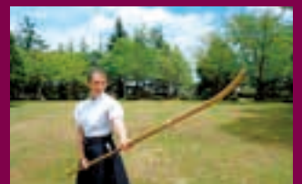
目標はなぎなた愛好会設立