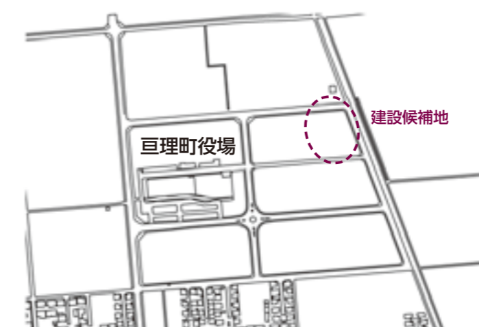
学校給食センター建設候補地

都市公園条例の一部を改正 提案理由 荒浜地区に整備したスケートボードパークを鳥の海公園の有料公園として位置づけるほか、それらの使用料を定めるため、条例の一部を改正する。 (全員賛成で可決) スケートボードパーク使用料 個人利用は無料。競技大会のため占用して使用する場合は、1時間あたり3000円。