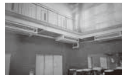
市川市国分小学校体育館のエアコン設置例

「一般質問」は町長に対し、将来に向けての考えなどを質すものです。今回は11人の議員が登壇し行いました。