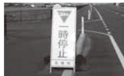
優先道路なのに「一時停止」

【問】 町道が森林所有者から経営の管理の委託を受け地域の林業経営者に再委託。あるいは市町村が管理する制度。財源は森林環境税等。 【答】 令和6年度からの料金改定を予定しておりますが、導入効果を考慮した上で、県と慎重に協議を行います。