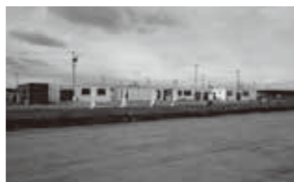
ワンテールパーク