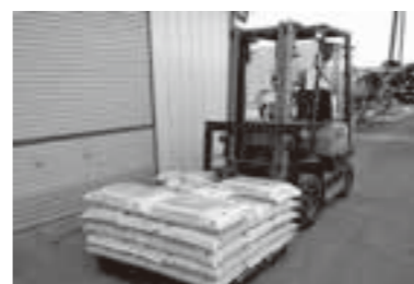
高騰している肥料

■ 農業資材費など価格の高騰が続いており、農業経営継続のため町独自の支援策は。 [問] 国、県、JAなど農業関係機関と情報の共有を図りまして、今後の価格推移を見極めながら必要な施策を検討していきたいと思っております。