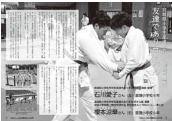
大きな写真を使ったインタビュー記事

② 予算・決算審査について、写真を使用した分かりやすい内容に変更しました。 ③ 全体的なレイアウトを見直し、統一感のある配置に変更しました。