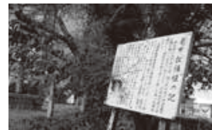
雑草が繁茂する亀甲松公園

【問】 亘理郡の豪族である藤原経清は、奥州藤原氏の祖。本町との歴史的経過から、世界遺産の町である平泉町との文化交流などは。 【答】 初代清衡の実の父であります。この事実のみで、町内に史跡が見つからず、現段階では難しいと考えます。