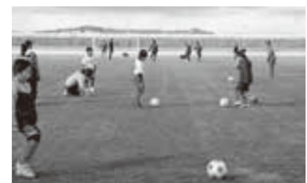
荒浜ジュニオールFCの元旦初蹴り

■ 地域の関係団体、学校関係者、関係各課との協議・検討を進め、本町における部活動の地域移行の方針などを策定し、令和5年度から7年度までの改革集中期間に部活動の地域移行ができるようにと考えています。