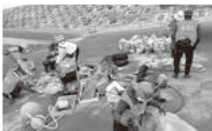
ボランティア活動の様子

【問】 コワーキングスペースを活用したセミナーなど開催してはどうか。 【答】 各種研修を受講した方の知識や問題意識の共有化を図り、コワーキングスペースなど活用しながら、人と人とのつながる場の提供に努めていきたいと考えています。