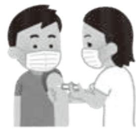
予防ワクチンの接種が重要

■ 保険適用外の带状疱疹予防ワクチンは、罹患率の低下や症状の軽減、合併症の予防等につながる。費用の一部を助成する自治体も増えており、本町でも、ワクチン接種に対して助成を行ってはどうか。 [問] 現時点では検討していませんが、十分に情報収集を行いながら、他の任意接種とのバランスを念頭に置いて検討してまいります。