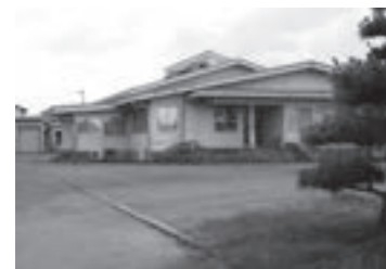
学校給食センター

【問】 協働で巨理の未来を創っていきまします」との政策に「巨理町国土利用計画の改定を進めます」とあるが、具体的な取組方法と完了時期はいつか。また、県から公表された「津波浸水想定」も念頭に作成されると思うが。