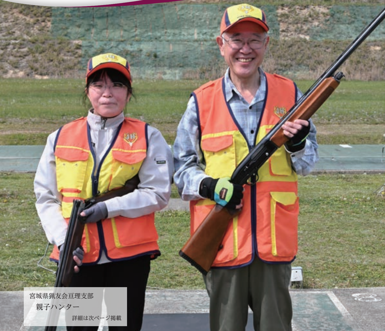
宮城県猟友会巨理支部 親子ハンター 詳細は次ページ掲載