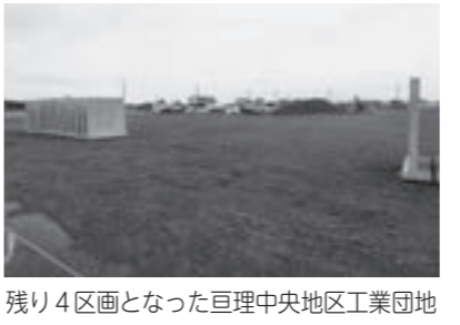
残り4区画となった巨理中央地区工業団地

土地売買契約の締結（巨理中央地区工業団地企業誘致事業） 提案理由 工業用地として、巨理中央地区工業団地の一部を企業へ売り払う協議が調ったことから、売買契約を締結するにあたり、議決を求めるものです。 所在地 巨理町逢隈高屋字堂田42番15（2万4091・21㎡） 契約の相手方 山形新興(株) 契約金額 3億4932万円 （全員賛成で可決）