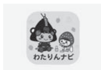
子育て応援わたりんナビ

【問】 「子育て応援わたりんナビ」の利用者は800名まで増加しています。また、町税等の納付に決済アプリを利用されている町民の方もいます。