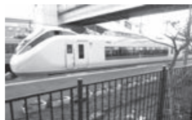
巨理駅へ停車本数増が要望される特急「ひたち」号

【問】 エレベーター周辺通路の汚れがひどい 【答】 エレベーター周辺通路の汚れがひどい