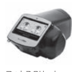
フォトスクリーナー(屈折検査機器)

※フォトスクリーナー(屈折検査機器)とは 瞳孔の写真を何枚も 撮影することで屈折 異常や斜視の有無を 検出する器械