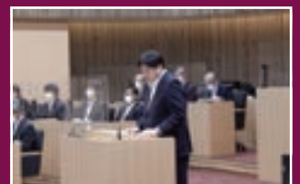
山田町長 2期目スタート