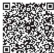
会議等出欠状況表