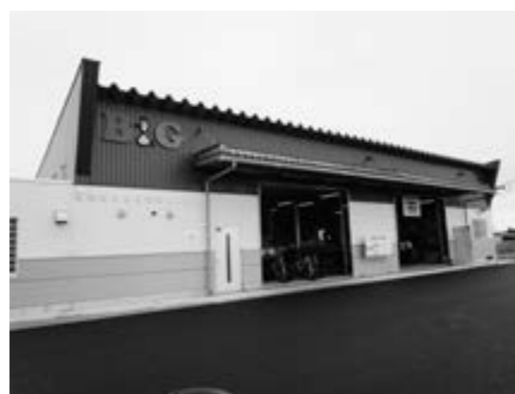
B&G海洋センター艇庫