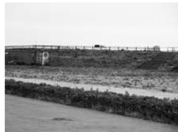
スケートボードパーク予定地