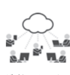
ビジネスチャットで情報を共有