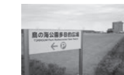
利用促進が求められています

【問】 令和4年3月末に基本構想を変更しました。整備計画は、7地区ほ場整備区域登記完了後になります。