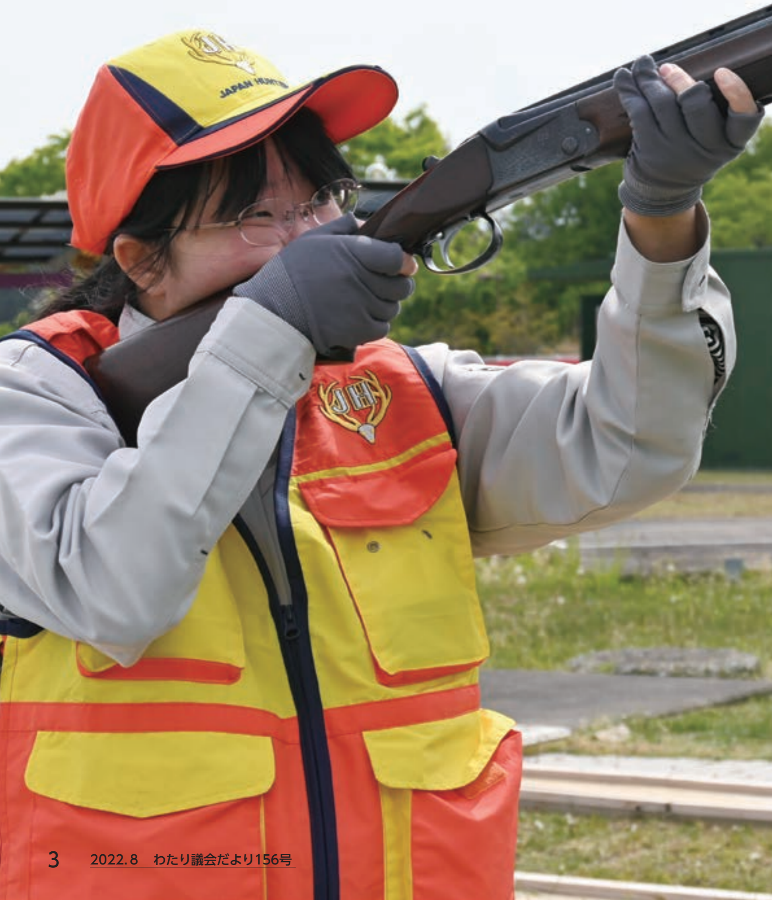
インタビュー・写真 小野明子・鈴木秀一

菜緒美さんが受講した「新人ハンター養成講座」は、宮城県が主催し、村田町のクレイ射撃場で行われています。お父さんも、訓練を見て興味を持ち、一緒に狩猟免許を取得されました。山の知識が豊富なお父さんのことを、とても頼りにしているそうです。