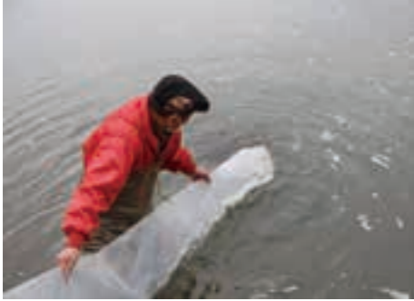
放流を行う漁協関係者

放流を行った漁協関係者は、「小さいながらも一生懸命に泳ぐ姿を頼もしく思い、4年後の再開を楽しみにして送り出した。」と期待を込めて話していました。