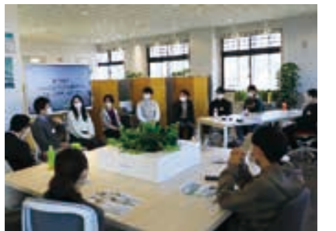
若手社会人の経験談に耳を傾ける学生たち