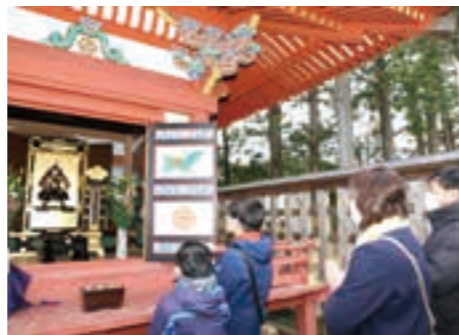
成実公木像に手を合わせる家族