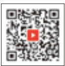
▲作品はこちら (YouTubeサイト)

今回の応募作品は、町公式YouTubeから視聴することができますので、ぜひご覧ください。