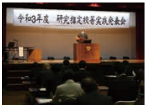
多くの教諭らが2学期制導入の課題や効果の発表に耳を傾けた