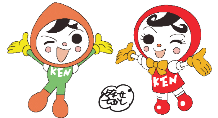
人KENまもる君 人KENあゆみちゃん 人権イメージキャラクター