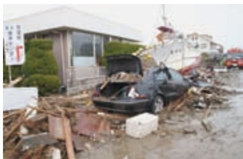
震災当時の荒浜中学校付近

この大震災によって、学んだことがあります。どんなに辛いことがあっても笑顔やさりげない言葉で心が温かくなるということ。そして大きな支えになるということ。同じ目標をもって努力することによって、絆が深まり、希望になるということ。生まれ故郷、荒浜を思うと、心が苦しくなりませんが、必ず荒浜は復興すると信じています。だから、私はこの巨理中で、同じ目標に向かって頑張る友と一緒に、将来の巨理町を担う力となるよう、心を磨いていきます。