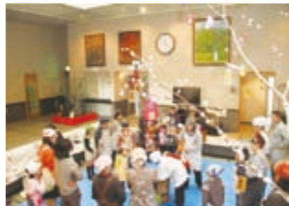
伝統行事を楽しく体験する参加者

小正月の伝統行事を体験する「お餅をついて団子さしをしよう」が一月九日、郷土資料館で行われ、二十一人の親子が参加しました。団子さしは、小正月の一月十四日に、ミズキの枝に団子や切り餅をさして飾る行事です。ミズキにさす団子や餅は作物の実りに見立てて、その年の豊作を祈願し飾られます。このため、団子や餅は多ければ多いほど縁起が良いとされています。 この日は荒浜婦人会のみなさんが講師となり、団子さしの意味などをわかりやすく説明しながら、団子や飾り物を体裁良く飾るコツなどを伝授していました。参加した子どもたちは、体中に白い粉を付けながら飾り付けに夢中になっていました。 講座では、餅つきも行われ参加者はつきたてのきな粉餅をほおばりながら、婦人会のみなさんが語る昔の小正月の話に耳を傾けていました。