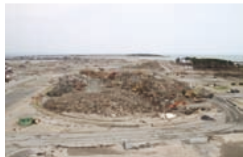
がれきが山積されている仮置場

取り除いてほしいということ。今でも荒浜には津波の爪痕が残っており、その光景を見るととても悲しくなってしまうからです。