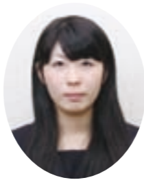
巨理高等学校3年 子ゆり

まず、【いちご農家の復興】です。企業の社会貢献の一環として、巨理にいちごを植えてもらい、実つたいちごは企業の販売ルートにのせ、日本全国で販売してもらいます。糖度が高く品質もいいので、間違いなく巨理ブランドのいちごは、全国区になり雇用促進、人口増加につながるでしょう。