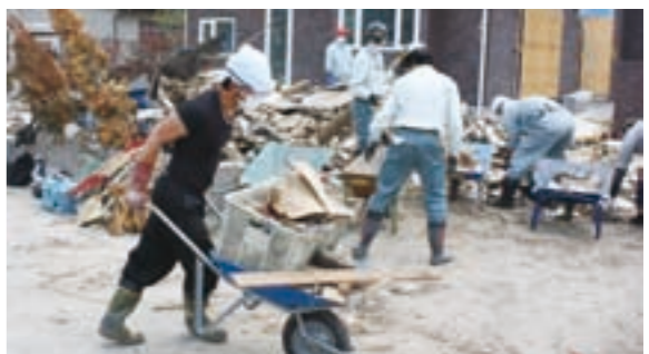
復旧の大きな力となっているボランティアの活動

一つ目は「きれいな町」です。地域には、ゴミを拾ってくれている人たちがいるので、巨理はきれいな町になると思います。その姿を見て僕もみんなのことを考えて行動できる人になりたいと思いました。