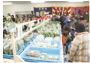
大盛況のふれあいの市場

東日本大震災で被災した「鳥の海ふれあいの市場」が十二月二十三日、荒浜築港通りの仮設店舗で営業を再開しました。市場は、わたり温泉鳥の海一階に地場産品の産直市場として平成二十年二月にオープン、年間十七万人の来客があり、町の観光の一角を担っていました。震災では売場が跡形もなく流出し、市場を運営する鳥の海ふれあいの市場協同組合では、組合員が力を合わせ再開に向け準備を進めてきたものです。 オープン初日は、レジに長蛇の列ができるほどの盛況ぶりです。荒浜漁港で水揚げされたばかりのカレイ・ヒラメなどの水産物や新鮮な野菜などが多数陳列されていました。また、仮設店舗には漁港前で営業していた海産弁当フーリングも弁当などを販売していますので、ぜひお立ち寄りください。仮設店舗は当分の間、土・日曜日と祝日に営業するということです。