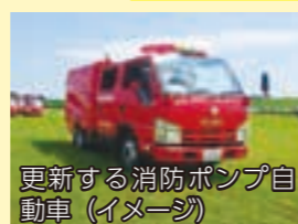
更新する消防ポンプ自動車(イメージ)

巨理町消防団逢隈分団に配備している消防ポンプ自動車の老朽化のため更新を行います。逢隈分団は、台風などの大雨時の水防活動の際に中心となる分団であるため、消防活動にのみ特化した車両ではなく、水防用の資機材などを積載できるなど、多機能型の車両にて整備します。