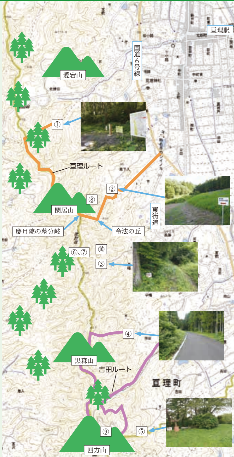
⑩森の見晴台からの眺望