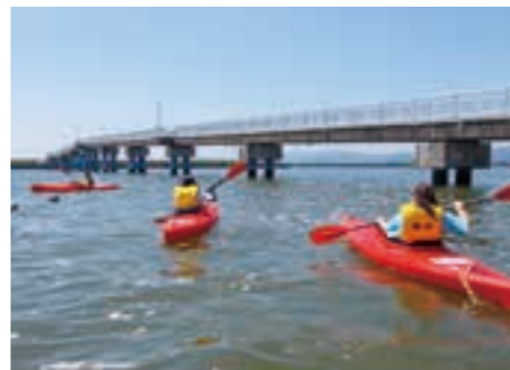
海風を感じながらカヌーを楽しむ参加者たち

カヌーを初めて体験した児童からは、「とっても楽しかったです。また体験しにきたいです。」と話がありました。