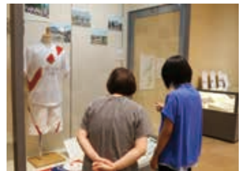
東京2020オリンピック聖火リレー紹介コーナーを観覧する来場者

同展は、9月5日まで開催予定で、ポスターや聖火リレー、トーチの展示のほか、本町出身のオリンピック競技大会出場選手や、町と復興ありがとうホストタウン協定を締結しているイスラエル国の紹介コーナーなども設けられています。