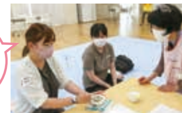
離乳食づくり体験