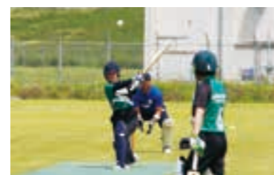
▲白熱する試合の様子