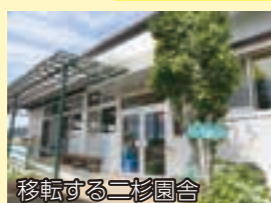
移転する二杉園舎

障害児通園施設である二杉園を民営化することに伴い、現在の施設を吉田保育所仮園舎に移転します。そのため、仮園舎の外壁やウッドデッキの修繕、園舎内の清掃など、新たな施設として活用するための改修工事を実施します。