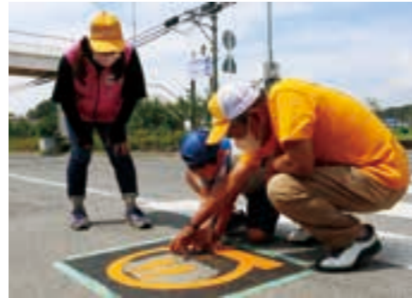
同会会員と協力しながら巨理小学校正門前に止まれ表示を設置する児童

参加した児童は「地域 みんなが、今回設置した止まれ表示を見て交通事故に気を付けてほしいです。」と話しました。