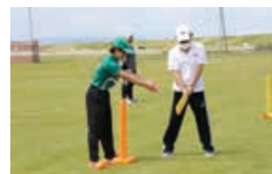
▲選手からアドバイスを受ける参加者

亘理町を盛り上げるために メンバーが今後開催を予定している 事業 ■賑わい集客イベントの開催