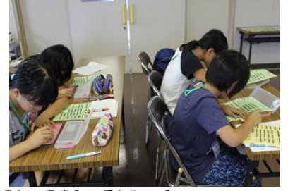
じぶん 自分の名前を なまえ 点字で てんじ 打ちました。

8月4日（木）の としょかんたんけんたい 図書館探検隊は にほんせいしいわねまこうじょう 日本製紙岩沼工場と みやぎけんしかくしょうがいしゃ 宮城県視覚障害者 じょうほう 情報センターに行きました。 しんぶんし 新聞紙が できるまでを けんがく 見学したり、 てんじたいけん 点字体験を しました。