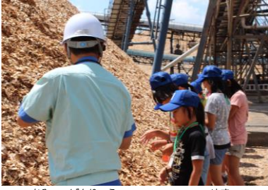
かみ 紙の原料の げんりょう チップの やま 山！

今年も、 いちにちとしょかんいん 一日図書館員や こうさくきょうしつ 工作教室、 としょかんたんけんたい 図書館探検隊、 よる 夜の図書館探検隊をにたくさんの お友達が ともだち 参加し、 さんか 図書館はにぎやかな夏休みでした。