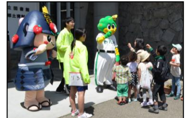
▲ わたりん & ケヤッキーとじゃんけん