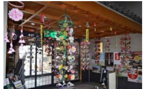
▲ 1階エントランスホールのつるし雛

く伝えられたつるし雛を、常設展示室と悠里館1階エントランスホールに展示しました。