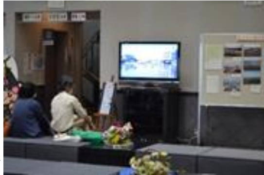
4月8日の上映会の様子▶

今年度からは、より多くの方々に映像を観ていただくため、毎月第二土曜日と翌日曜日(令和6年2月は第三土曜日と翌日曜日)に開催いたします。上映日は右の表のとおりで、9時から16時30分まで約16分の映像を流し続けますので、震災写真とあわせてぜひご覧ください。