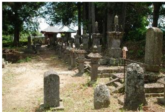
▲ 巨理領主伊達氏歴代墓所(大雄寺)

巨理のため、仙台藩のために尽力してきた歴代領主たちは藩主からの信頼が厚く、その証は名前にも表れているのです。