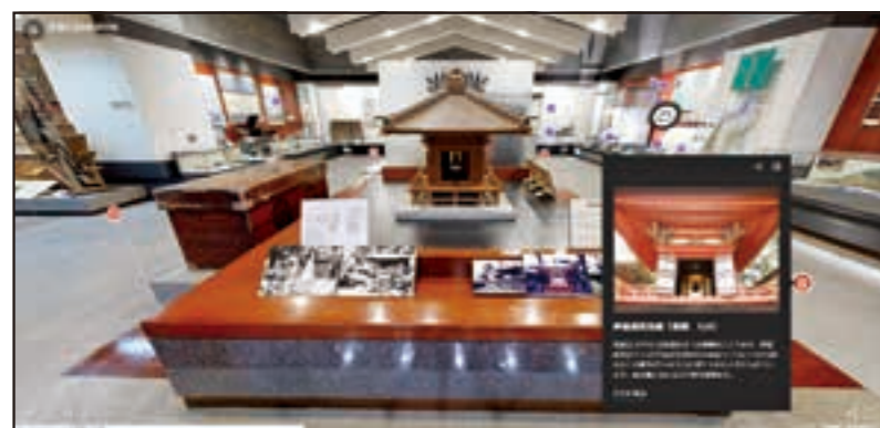
▲郷土資料館のバーチャルツアーでは、展示品の解説を読むことができます。