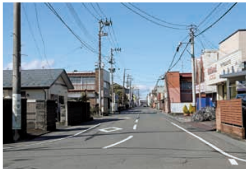
現在の五日町通り（令和6年3月撮影）