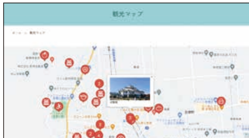
▲観光マップでは、町内の観光スポットが一目で確認できます。