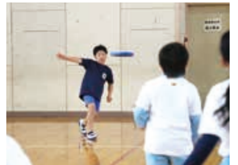
相手チームへディスクを投げる児童

3月25日に佐藤記念体育館で、ドッジボールをディスクに代えたドッジビーの大会「第10回ドッジビー大会」が開催され、町内8カ所の児童クラブから180人の児童が参加しました。これは、ドッジビーで子どもたちを笑顔にすることを目的に、東日本大震災の被災地にディスクを届け、ドッジビーの普及活動をしている「HappyDiscProject」が、平成24年から開催している大会です。当日、会場には練習の成果を存分に発揮し、仲間と協力しながら競技に挑む子どもたちの笑顔と歓声が溢れていました。