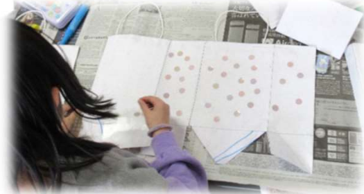
シールをはったり、絵を描いて、世界で一つのオリジナルエコバックになります