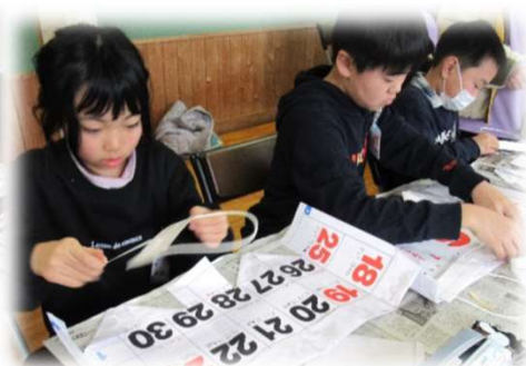
持ち手をつけます