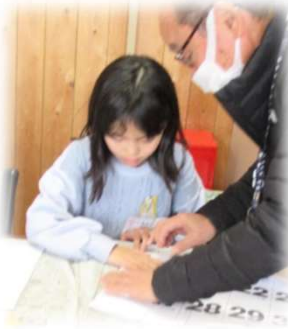
線にそって折り目をしっかりつけます