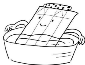
牛乳パックを煮込む