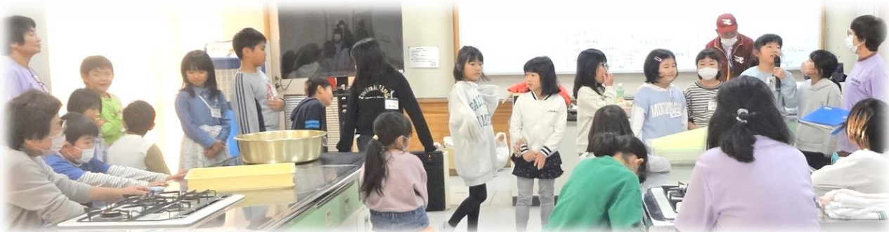
帰りの感想発表では多くの感想を発表 …… 『難しさはあったけれども、とても楽しかった』