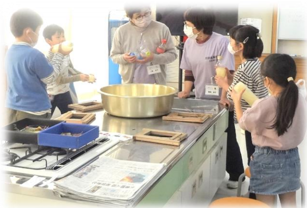
細かくした繊維をペットボトルにいれシェイクシェイク