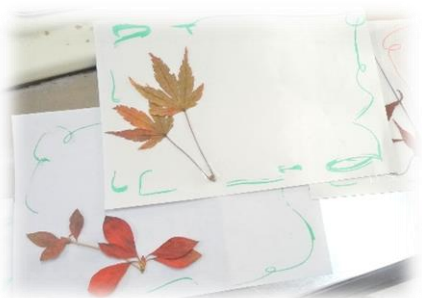
ちょうどわたり里の紅葉の時期 …… たくさんの落ち葉を用意