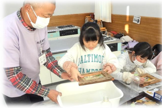
いよいよ『紙漉(す)き』のはじまり