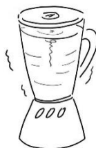
ミキサーで細かくして