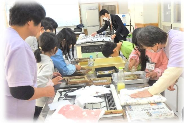
1回目に紙をすいて形を整えます 次は落ち葉を敷いて 2回目の紙すきを行います