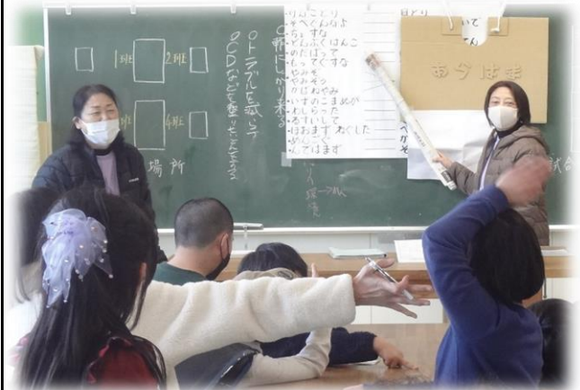
荒浜方言のレッスン教室開催 「けんことり」「そべぐんなよ」「ちよすな」「どんぶくはんこ」