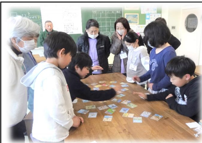
班対抗戦でかるた大会が進行しました