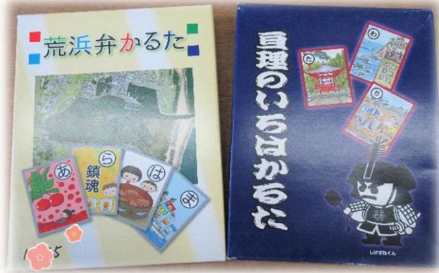
『荒浜弁かるた』と『巨理のいろはかるた』