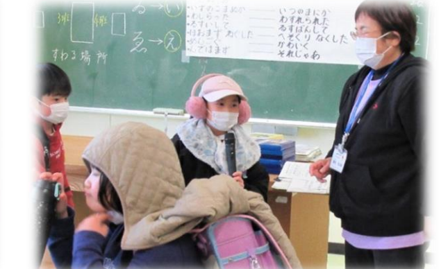
感想は『楽しくてもう一回やってみたいです』