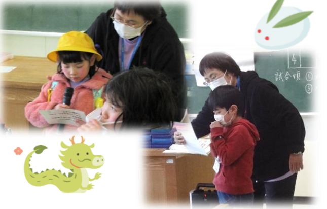
会の進行はいつも自分たちで行いました