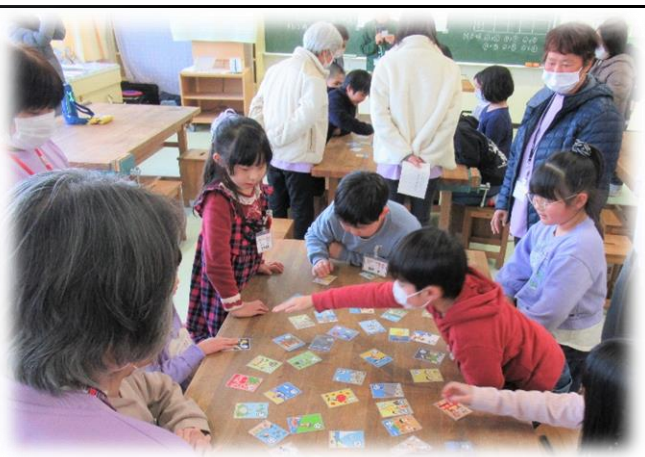
結果は20数枚ずつ取り合う大接戦