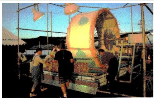
孢子を養殖網に付着させる (8~9月)