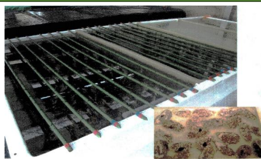
春に孢子が生まれカキ殻に付着 (3~9月)