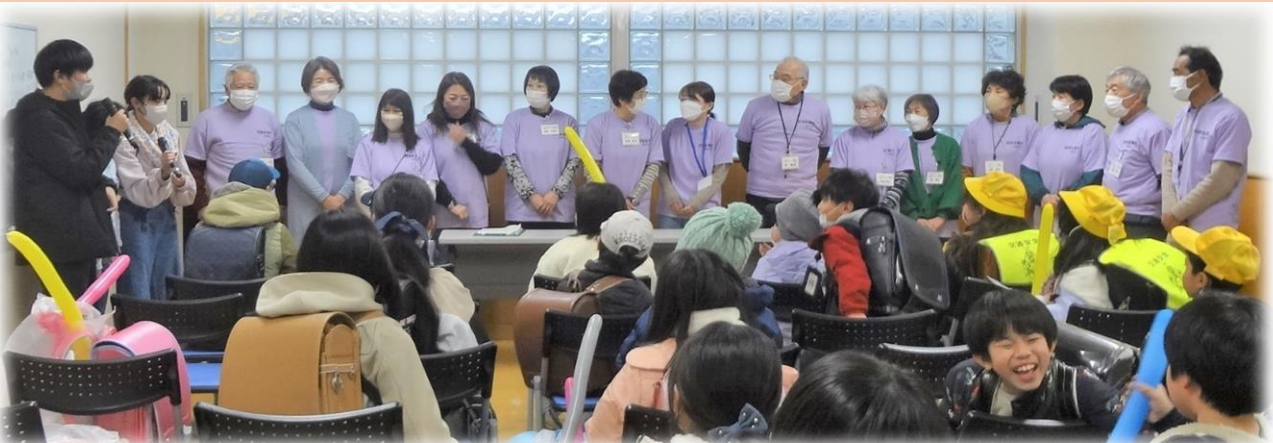
6年生の皆さんからの言葉「私たちのために楽しい企画を1年間ありがとうございました」