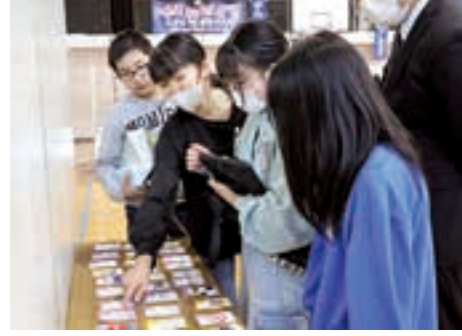
他校の活動について話し合う児童たち

当日は、各校の代表者が学校でのいじめ防止活動を発表したほか、いじめを発生させないための手段や方法についてグループごとに意見交換が行われました。 参加した児童生徒は、「学んだことを学校のみならず共有し、町からいじめをなくしたい。」と話しました。