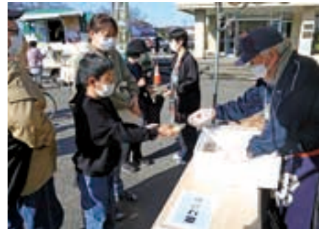
つきたてのお餅を受け取る来場者