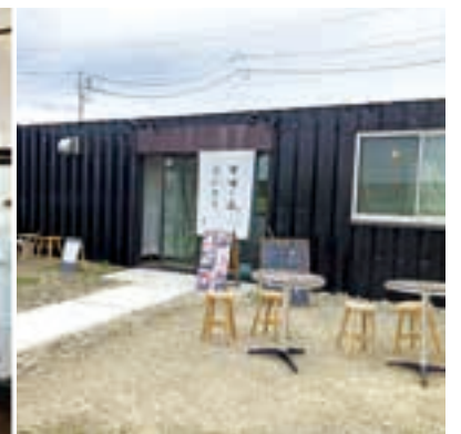
▲ 外観) 黒く塗られたコンテナが目印