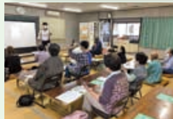
▲各地区の集会所にて