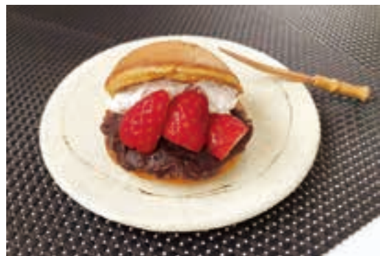
※いちごが小さいため、写真では1個につき3粒使用。