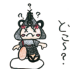
オープンカーさん