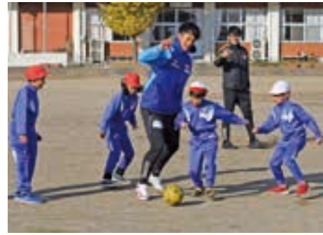
選手との試合に活気あふれる児童たち