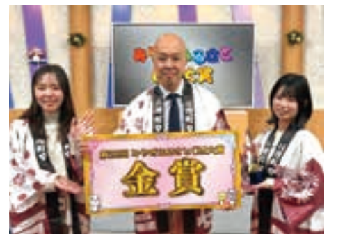
笑顔で目録を手にする制作スタッフ