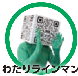
わたりラインマン