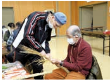
アドバイスを受けながら縄をなう参加者

当日、参加者らは、慣れない作業に苦戦しながら講師からのアドバイスのもとに縄をない、好きな飾りを選んでオリジナルのしめ飾りを作りました。 参加者は、「縄をなう作業が難しかった。自宅に飾って家族と良い新年を迎えたい。」と話しました。