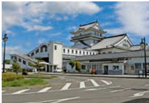
JR東日本お問い合わせセンター (☎050-2016-1600) 6時~24時

みどりの窓口で購入が必要なきっぷは最寄のみどりの窓口がある駅を利用ください。詳細は、駅係員まで問い合わせください。