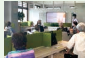
▲コワーキングスペースにて