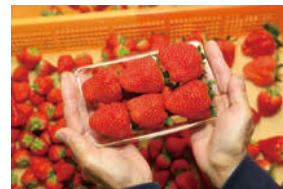
▲パック詰めの様子