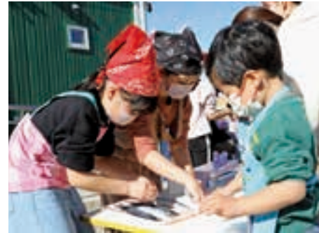
さんまに塩を振る参加者たち

同児童クラブの作間館長は、「このイベントが子どもたちの記憶に大切な思い出として残ってくれたら嬉しい」と話しました。