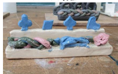
焼き上がるときれいな色に