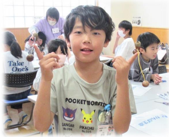
やじろべえの完成(両手に)