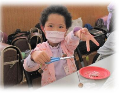
『やじろべえ』でみんな笑顔に つまようじの上でもバランスを取っています