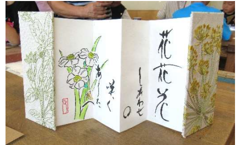
すてきな折れ帳ばかり！