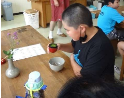
茶杓で抹茶をそっと茶碗に入れます