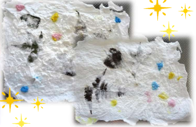
前回作製した紙が乾いて仕上がっていました