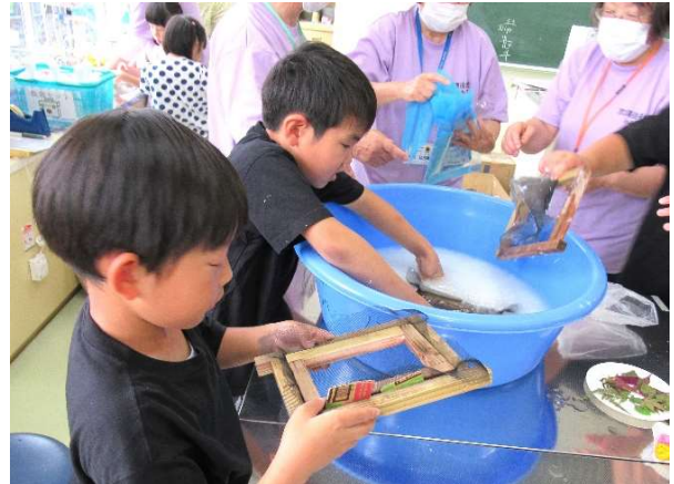
ここからが本番！！ 木枠を入れて、静かにゆらゆら～とゆすって均等に