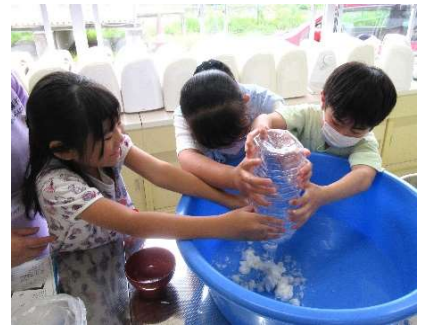
スタッフ準備のパルプ材も入れます