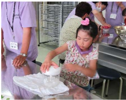
ミキサーでもっと細かく！