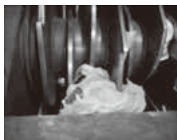
▲停止してしまったごみ処理機械

粗大ごみは清掃センターへ出してください プラ資源としてごみ集積所へ出されたごみが大きすぎるために切断されず、機械が停止してしまう事象が増えています。一辺50センチ以上のごみは粗大ごみに分類されます。粗大ごみは、清掃センターに直接持参してください。なお、資源ごみとして出す場合は、一辺の長さを必ず50センチ未満にしてから出してください。機械が故障し、ごみの処理に大きな影響を与えます。 例) ブルシート、ビデオテープ、蚊帳など