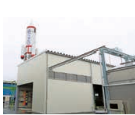
完成した山形新興株式会社新工場

山形新興株式会社の新工場が、巨理中央地区工業団地に完成し、6月14日に安全祈願祭および見学会が行われました。 同団地内南東部の約2万4千平方メートルの敷地に建設された同工場は、道路用側溝製品やガードレール用基礎ブロックを主力製品として、同日付けで稼働を開始しています。また、同工場では、骨材や金具、燃料といった原材料を地元業者から仕入れる予定のほか、町内を中心とする地元雇用新規採用を計画しています。