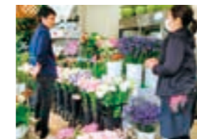
▲魅力の発見にワクワク

その後、店舗を通じた復興の役割が一段落したと感じたため、「まだ自分が本場にやりたいことに進んでいきたい。」という思いから、亶理町の協力隊に応募させていただきました。亶理町では、町の中心部にさらににぎわいを生み出していきたいです。そこで、小さなお店などを知ってもらおうために SNS アカウントを立ち上げ、亶理地区まちづくり協議会にも参加しました。日々の発信や交流を通じて、町のにぎわい創出を目指します。また、はらこめしの伝承や普及、地元のヒラメを使った新たな特産品の開発にも取り組み、亶理町の水産業を全国に広める一助になりたいと思っています！