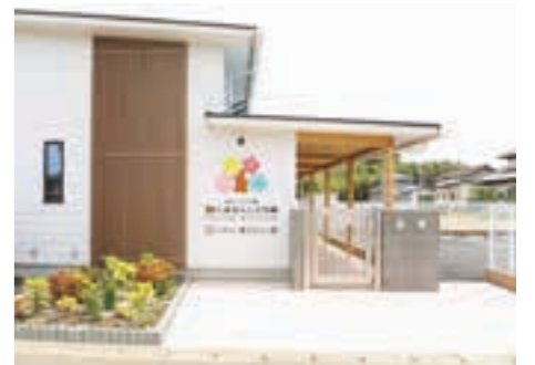
開園した認定こども園くまさんこども園