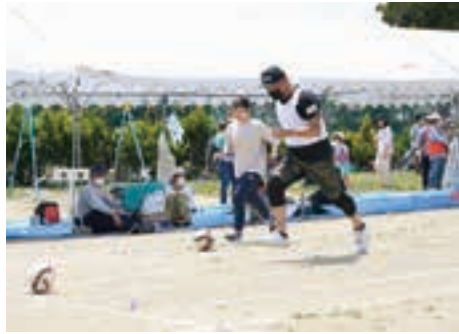
サッカーボールリレーをする地域住民たち

玉入れに参加した児童は「友達と協力して、いっぱい玉を入れることができて楽しかった。」と話しました。