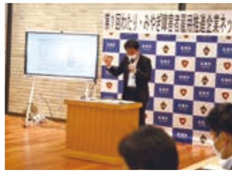
障がい者雇用に関する現状と課題を話す県の担当者

本ネットワークでは、今後も障がい者雇用に関する勉強会や合同面接会の開催が予定されており、町をモデルにした各種取り組みが他自治体へと波及されることにより、県内の障がい者雇用率の向上が期待されています。