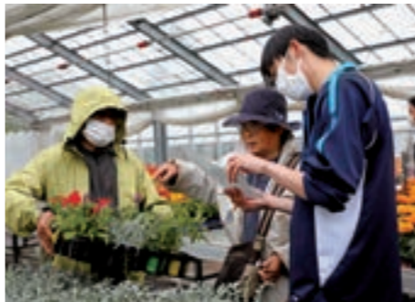
来場者に育てた花苗の説明をする生徒

販売初日は、あいにくの雨天にもかかわらず町内外から多くの来場者が訪れ、来場者たちはナスやカボチャ、キュウリなどの野菜苗のほか、マリーゴールドやペチュニアといった色鮮やかな花苗を吟味しながら選んでいました。生徒からは「お客さんと直接コミュニケーションを取りながら販売することができて楽しい。種から大切に育てた苗を多くのお客さんに買い求めてもらえたことがとても嬉しい。」と話がありました。