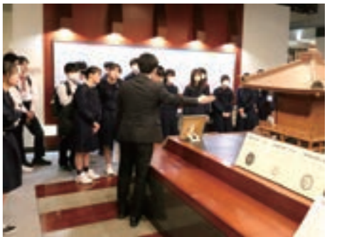
伊達成実霊屋の説明に熱心に耳を傾ける生徒たち

生徒からは「震災の悲惨な状況から復興を遂げた巨理町の苦労を実感した。」と話がありました。