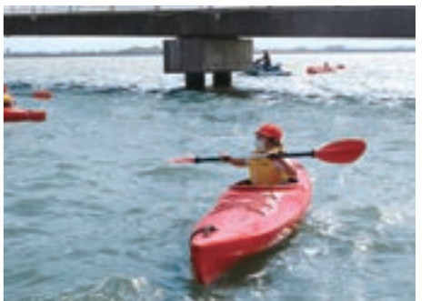
頑張っておールをこぐ児童たち

体験学習を終えた児童は「オールが重くて疲れたけど、風が気持ちよくて楽しかった。」と笑顔で話しました。