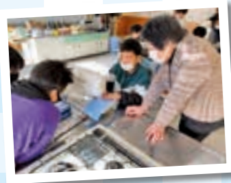
逢隈地区婦人会のみなさん