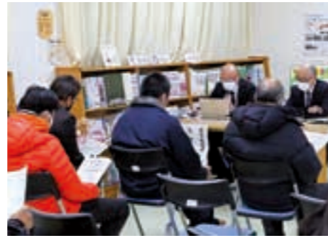
教育委員会職員の説明に耳を傾ける来場者たち

なお、本構想(案)は、町公式HPや教育総務課窓口で閲覧することができますので、ぜひご覧ください。