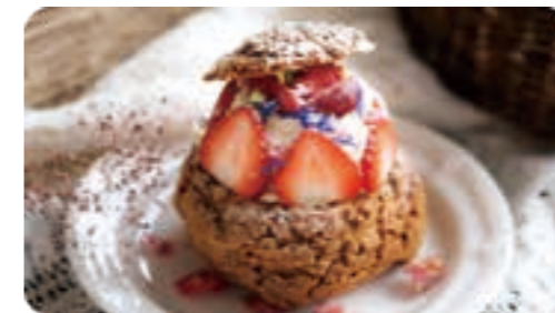
クッキーシュークリーム 季節限定☆フレッシュ苺のホワイトモンブラン