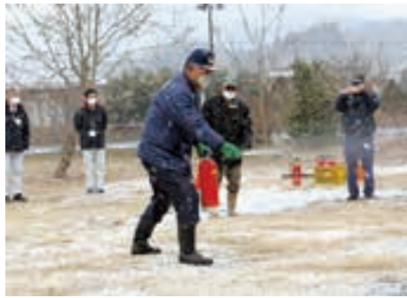
初期消火訓練を行う参加者たち

参加者は、訓練終了後、講評や称名寺の歴史と文化財についての説明を受け、いざというときの行動を確認するとともに、地域の文化財への関心を高めていました。