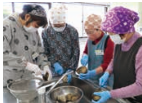
ナイフを使ってほっきめしの殻を剥く参加者たち

当日は食生活改善推進員の協力のもと、16人の参加者がほっきめしや里芋和え、すまし汁の調理を楽しみました。参加者は、「ほっきめしの殻がとても大きく調理するのが大変だったが、協力しながら美味しく作ることができてよかった。」と笑顔で話しました。