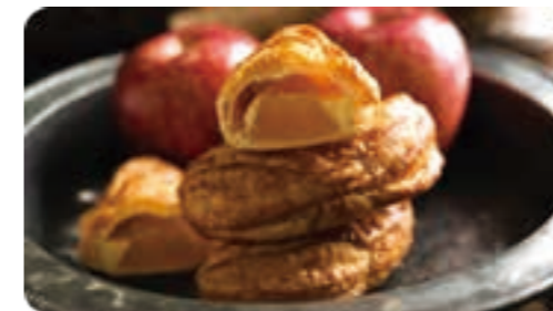
KIBOUのアップルパイ シナモンは使わずに巨理のりんごの風味をしっかり!