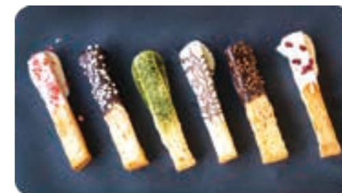
koeda ラスク 人気のプレーンラスクにチョコをトッピング