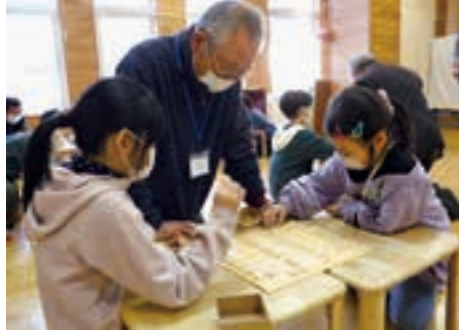
巨理将棋愛好会の指導のもと、楽しそうに将棋を指す児童たち

参加した児童からは「初めて友だちと将棋をしてとっても楽しかった。またやってみよう」と話がありました。