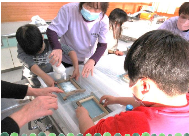
網を敷いた木枠に、ペットボトルの中身を流します