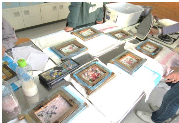
ピンクや水色のハガキもあります