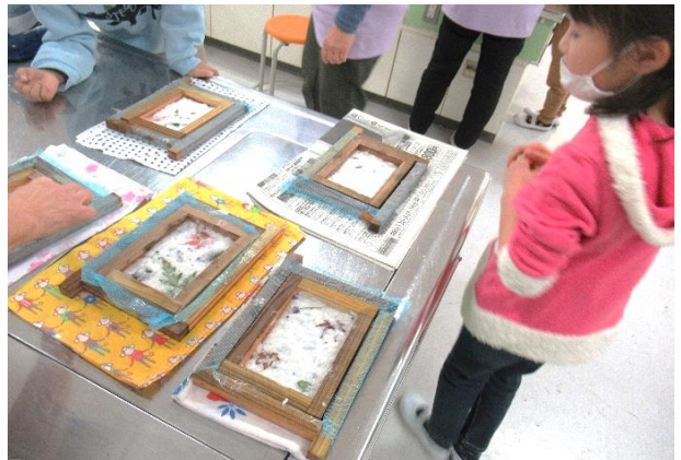
来週の出来上がりが楽しみです！