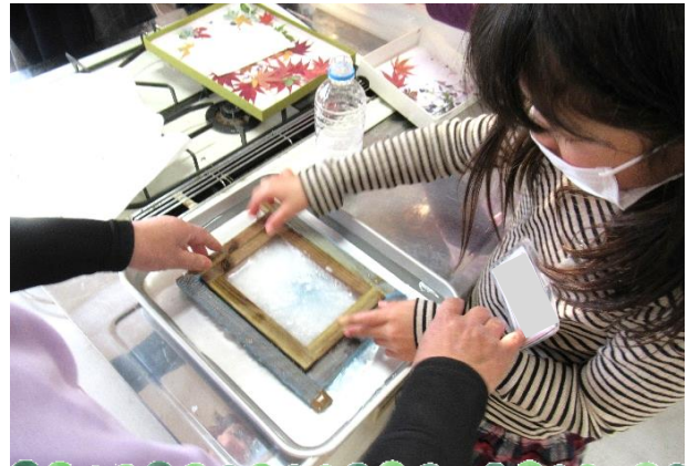
きれいなカードになりますように🌸