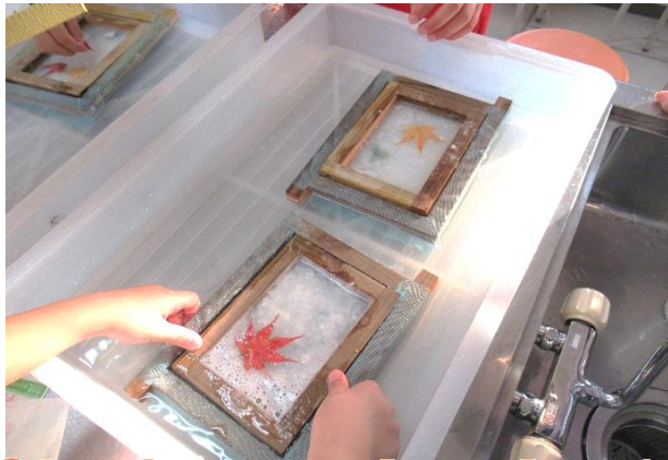
水の中でゆらゆら…均等にならします