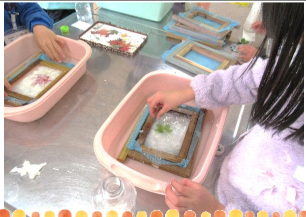
好きなお花や葉っぱを入れました