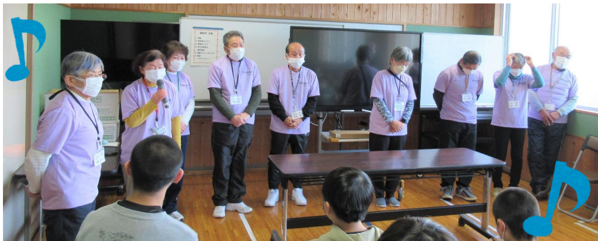
「みなさんから元気もらいました。また一緒に楽しくすごしたいです！」