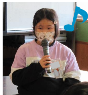
「いろいろな活動があって、放課後楽校は、楽しいことがいっぱいでした」と発表