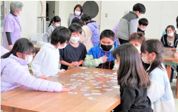
こちらも札に手が伸びて(2班)