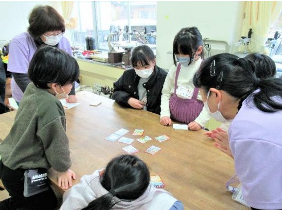
読み札を聞いている(4班)