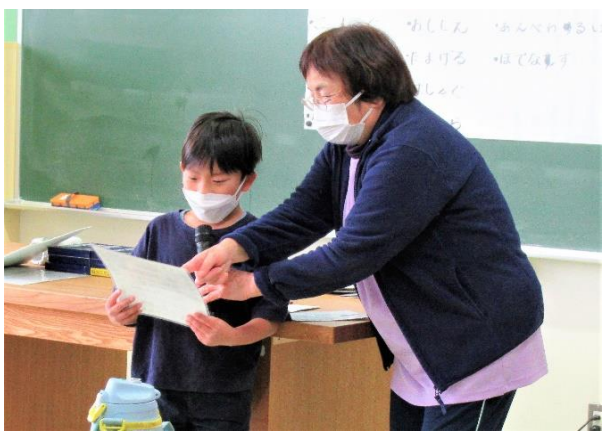
はじめの会 日直は2年生