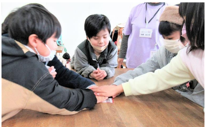
手が札めがけいっせいに!(5班)