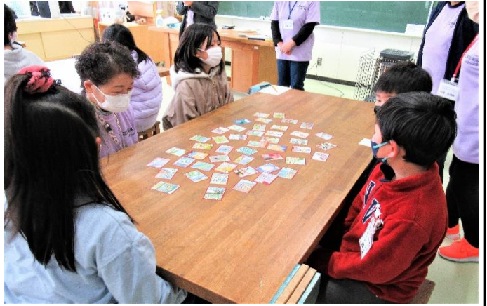
最初のルール「手は机の下におく」(3班)