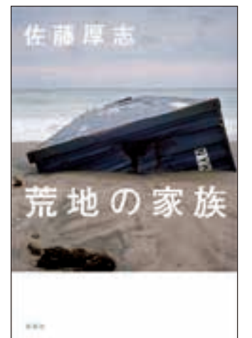
▲出展: 佐藤厚志『荒地の家族』(新潮社刊)