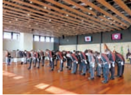
無火災を祈願する消防団員ら