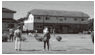
▲グラウンド・ゴルフを楽しむ様子

シニアクラブでは、豊かな地域社会づくりのため、仲間づくりや健康づくり、奉仕活動などに取り組んでいます。加入して活動してみませんか? 近くのクラブを紹介いたしますので、問い合わせください。 おおむね60歳以上の方 長寿介護課 ☎(34)13331