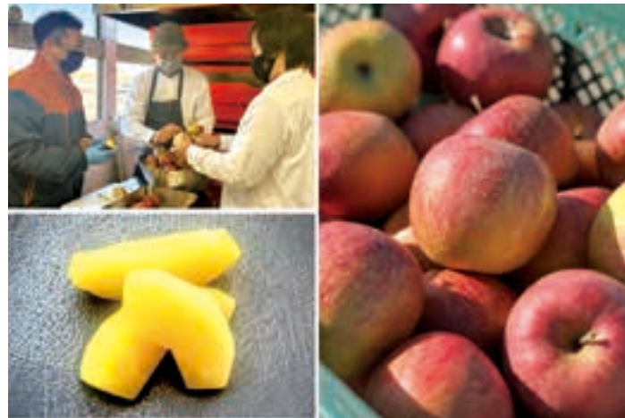
▲「りんごの味がしっかりしていて美味しい」などの嬉しい声とともに、アップルパイを求めて多くの方が足を運んで来ています。

常提供するメニューはもちろん、特別なコース料理などでも、旬の素材を生かした巨理の新しい美味しさを考案しています。 その中でも、町特産のりんごの美味しさを通年でみなさんに味わってほしいとの思いから考案したアップルパイはおすすめの一品です。使用しているりんごは、町内の生産者が育てた果汁豊富な「ふじ」で、やわらかく優しい甘さのコンポートに仕上げ冷凍保存し、旨味を閉じ込めています。 町のみなさんには身近な美味しさの再発見を、町外の方々には新発見を楽しんでいただきたいです。