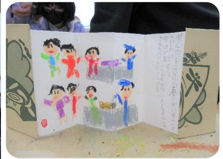
「税関職員になりたい」