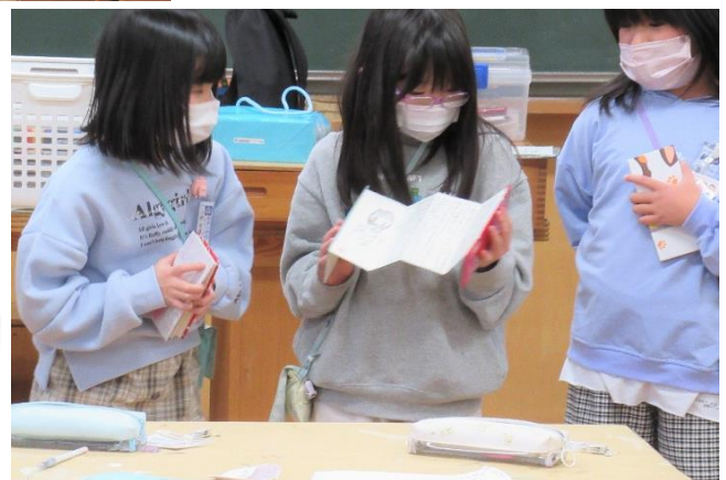
「バレーボール選手になりたい」

みなさんの素晴らしい夢の発表、ありがとうございました♪ またいつか折帳を開いてみてくださいね