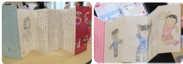
「パティシエになりたい」