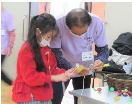
こま紐の巻き方を教えてもらいます