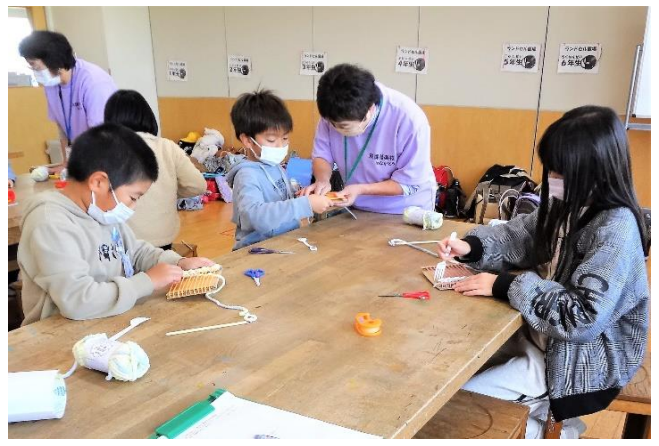
フォークを使って織りを整えます（4班）