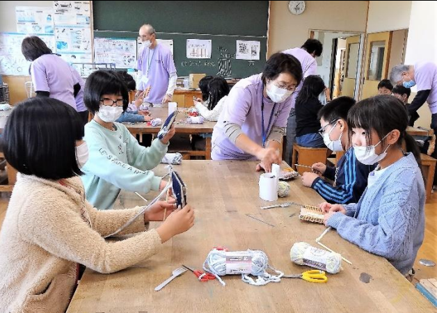
はたおりが仕上がってきました（5班）