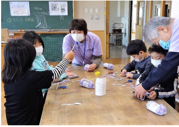
はたおり棒を使ってはたおり開始（3班）