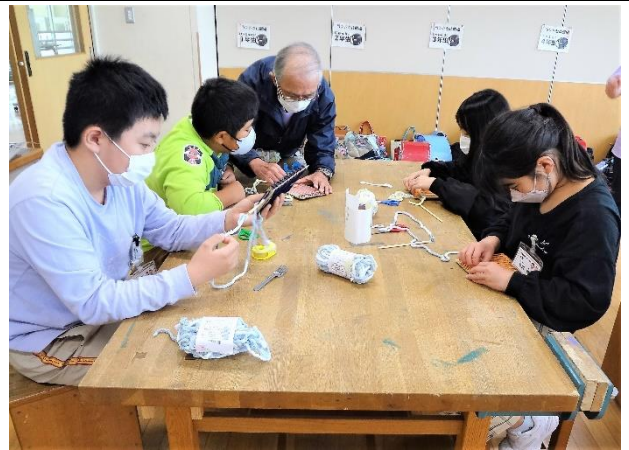
仕上げるまでの集中力がすごい（6班）