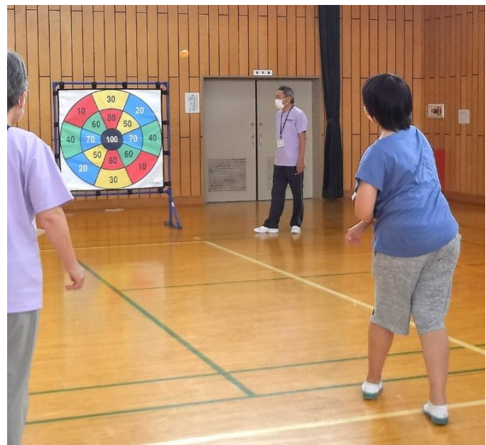
5年生の的当ての様子