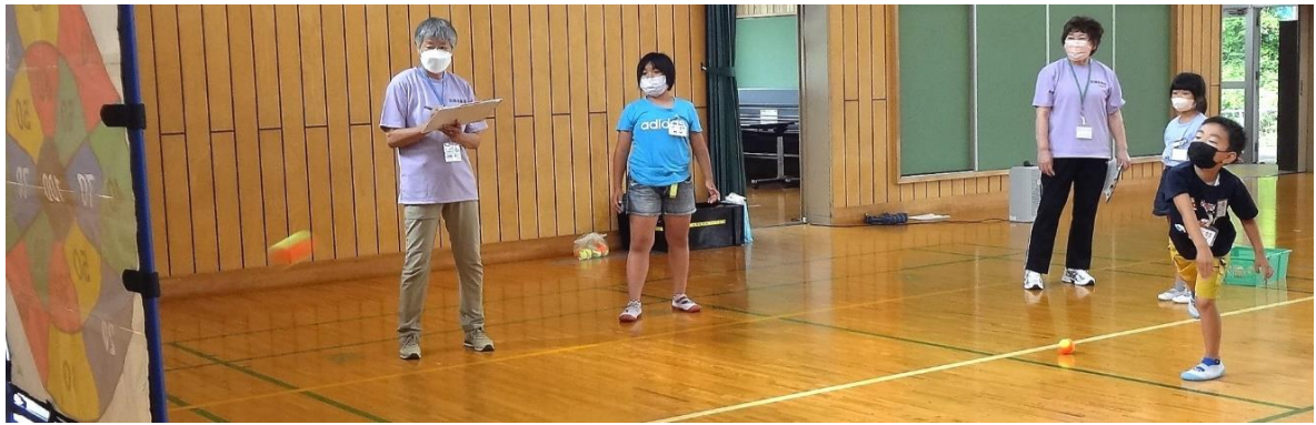
投球フォームが決まっています。高得点が期待できます。