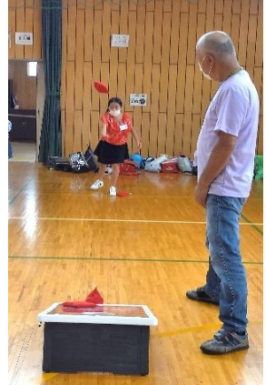
ピンバック（投げる物）を4個投球、台の上3点、穴の中5点