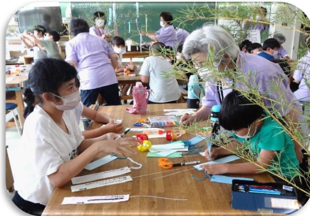
短冊を何枚も仕上げ（5班）