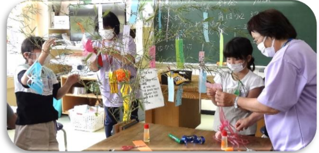
願いのこもった七夕飾りに（2班）