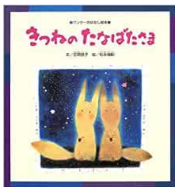
絵本『きつねのたなばたさま』