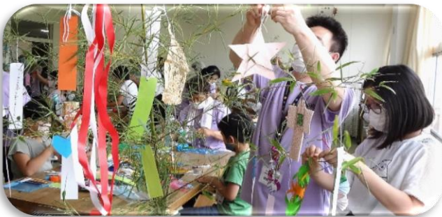
飾り付けは工夫をたくさん（1班）