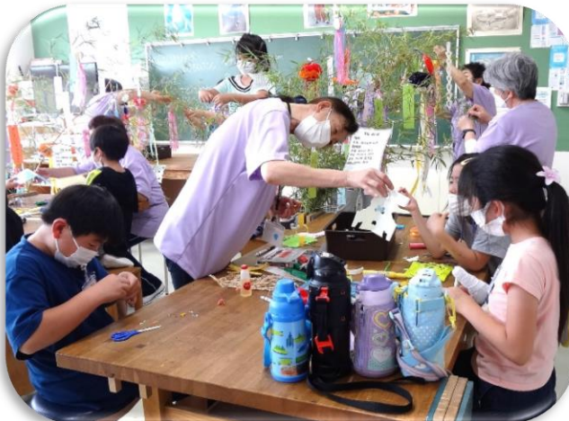
意欲満々たくさんの飾り付けをしました（3班）