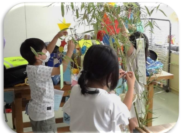
どの人も集中力がすばらしい（4班）