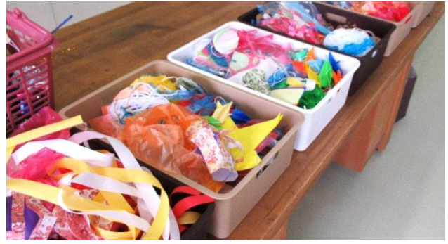
用意した飾り付けの数々