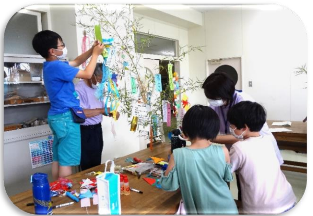
班長さんは高いところも飾り付け（6班）