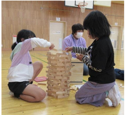
途中で崩れたけれど、再度挑戦！