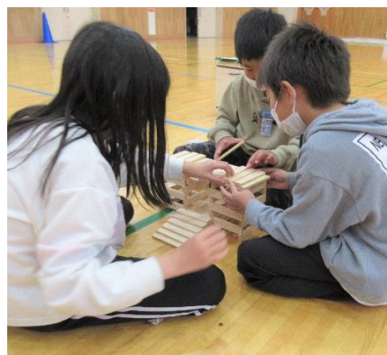
建物らしきものを製作中