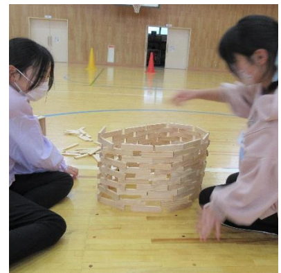
大きな円でどこまで高くなるかな？